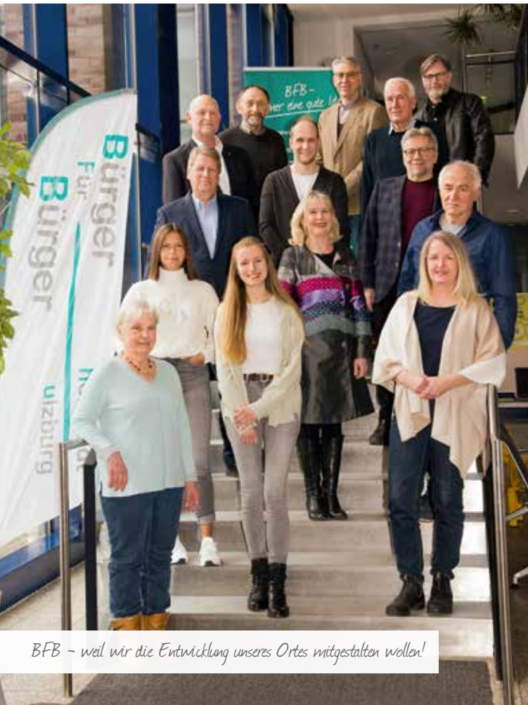
BFB - weil wir die Entwicklung unseres Ortes mitgestalten wollen!

Sie haben uns bei der Kommunalwahl 2013 und bei der Wahl 2018 Ihr Vertrauen geschenkt. Um dieses Vertrauen bitten wir auch bei der Kommunalwahl 2023.