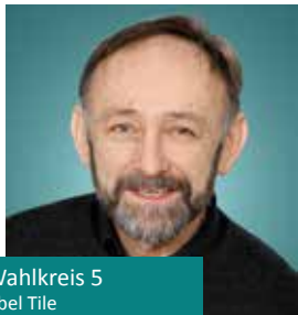
Wahlkreis 5 Abel Tile